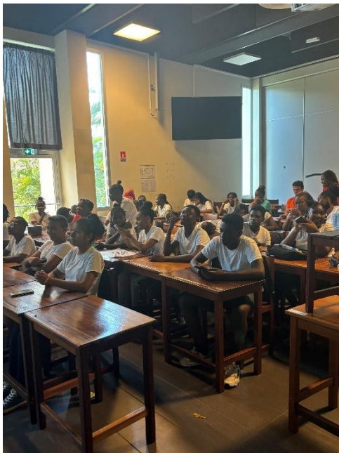
Un quiz sur les Cordées de la réussite.