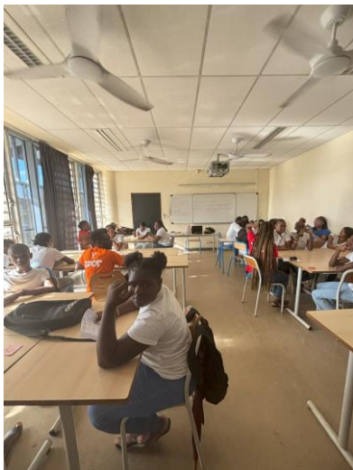
Un atelier composé de petits groupes

La journée a commencé par un atelier « se connaître, se redécouvrir » animé par la présidente de « Kunaka Coaching ». Le but étant de se connaître pour trouver sa voie professionnelle et son futur métier.