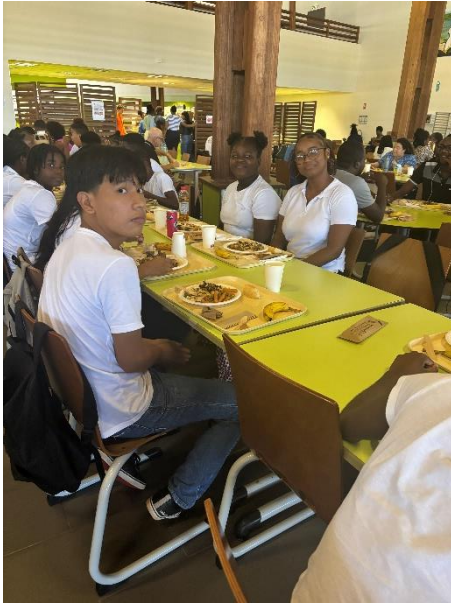
Petite pause déjeuner au restaurant universitaire

Puis un temps d'échanges avec les étudiants tuteurs sur les différentes filières et leur parcours universitaire.